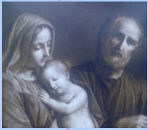
MISION SAN JOSE

“Asamblea Mundial de las Familias” Conferencias, Talleres e Informes: Ver, Juzgar y Actuar