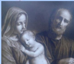
MISION SAN JOSE

New forms, new methods, service structures in line with the time, attention and inclusion discarded, etc.